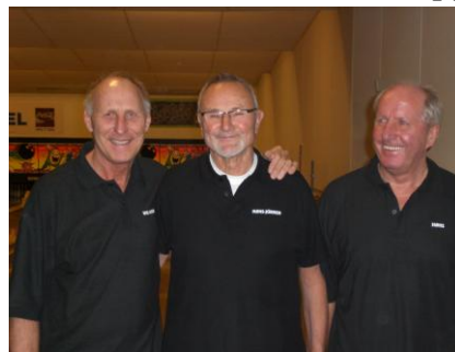
Fahrschule Bödeker 2